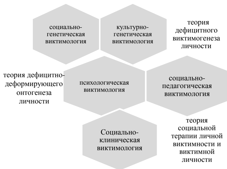
Рис. 1. Морфология системы социально-психологической виктимологии

В системе социально-психологической виктимологии теория дефицитного виктимогенеза личности рассматривается на двух уровнях: на социальном – социально-генетическая виктимология и на психологическом – культурно-генетическая виктимология.